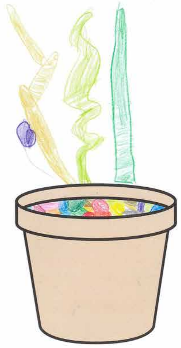
え 絵をかいてみよう

ながくきは長い？みじかい？太い？細い？ くまの色はなに色？ 葉っぱは、なに色？どんなかたち？ 113113 お花、黄色、みどり お花は、黄色、みどり どのくらい大きくなる？2.5m 花はさく？どのようなかたちの花？なに色？ しょくぶつのなまえは？ カラフルな木、黄色の所から咲く